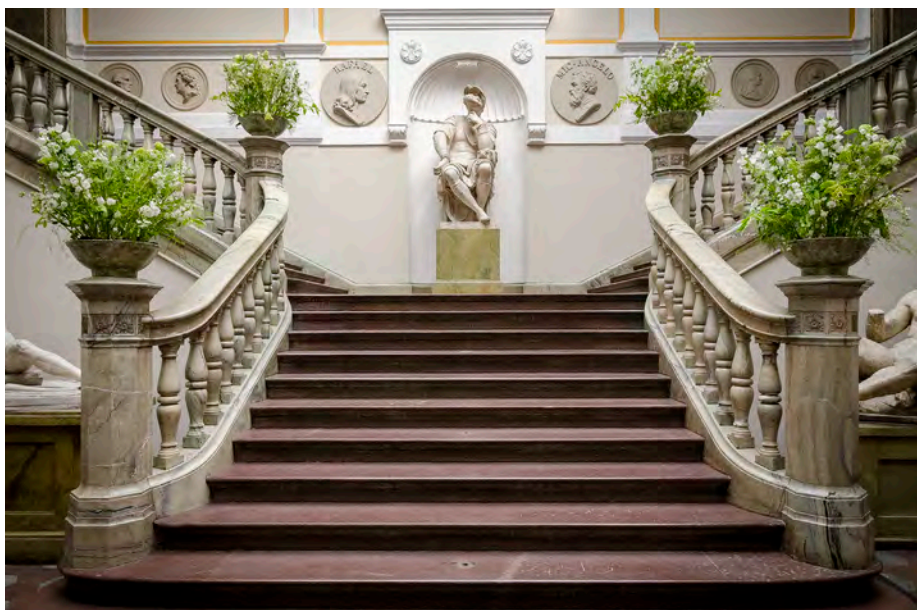
Konstakademien, Nikehallen.