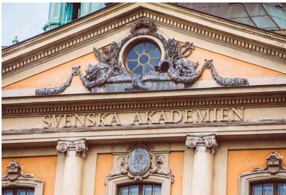
Svenska Akademien har sina lokaler i Börshuset vid Stortorget i Gamla stan.