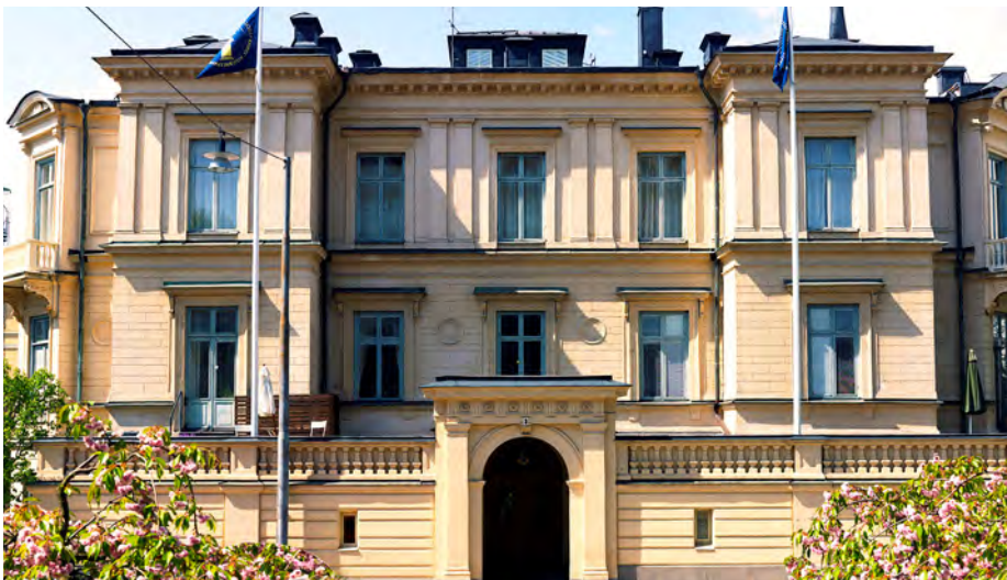
Kungl. Vitterhetsakademiens hus (Rettigska huset).