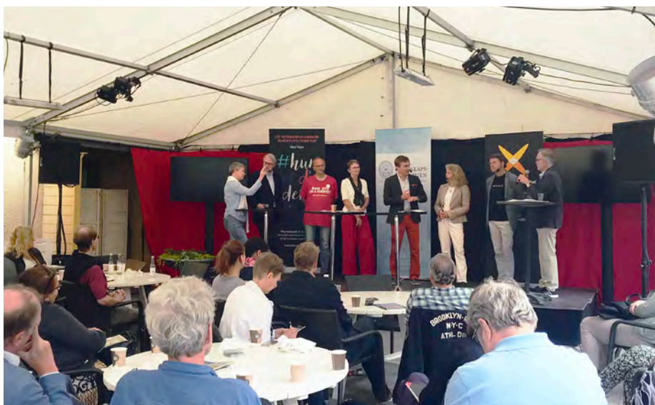
Almedalsseminarier är en av många utåtriktade aktiviteter i akademiens arbete med att stärka vetenskapernas inflytande i samhället.