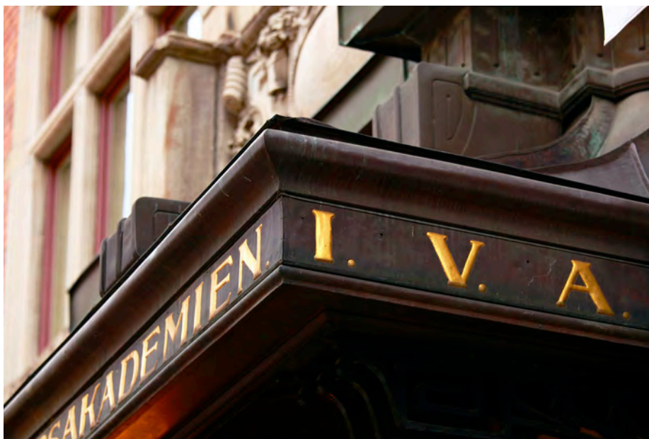
Entrén på Grev Turegatan där IVA huserar sedan grundandet 1919.