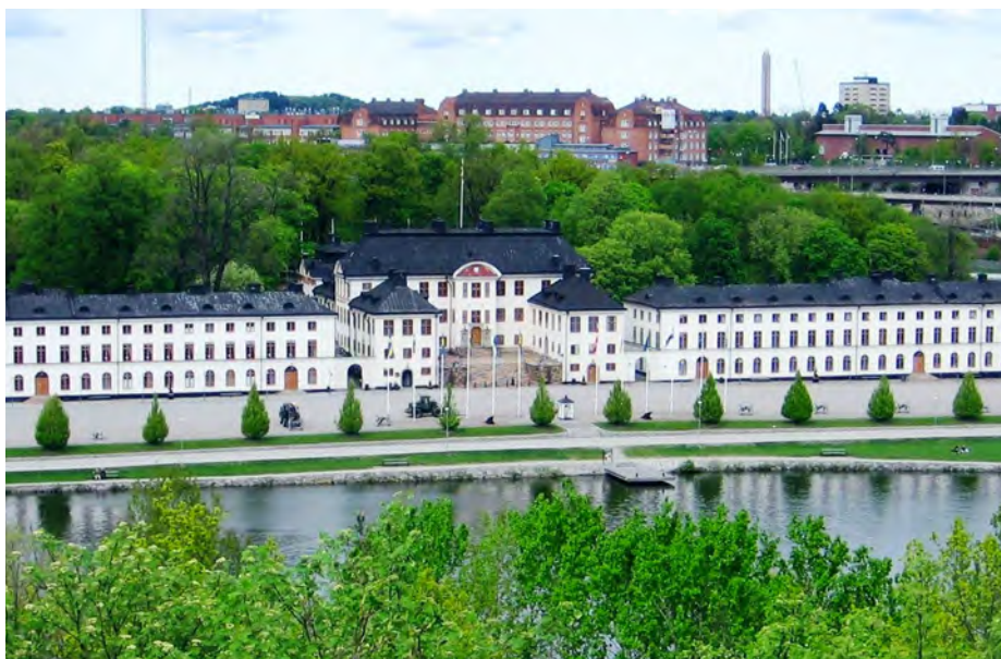
Här på Karlbergs slott och den dåvarande krigsskolan för armén och flottan, som inrättades 1792, föddes idén till att bilda en krigsvetenskaplig akademi.