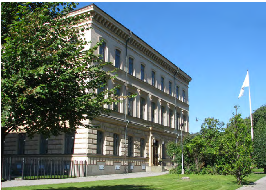
KSLA:s fastighet vid Drottninggatan 95 B i Stockholm.